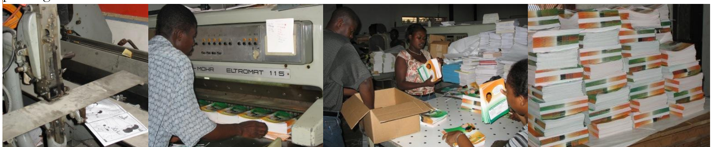
Ti Mag' sort de la presse de l'Imprimerie des Antilles

Ti Mamoun, Ti Zo et Ti Jan, les jeunes héros de la bande dessinée, ont de beaux jours devant eux mais n'ont pas pris la grosse tête!