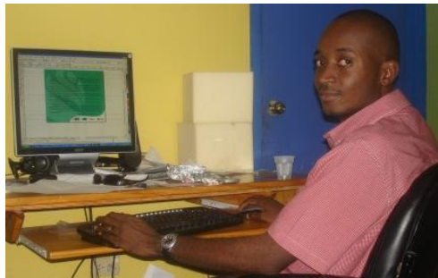
Dès qu'il s'agit de Ti Mag', Gardy répond toujours présent

Pour ce numéro 3, consacré à la protection de la forêt des Pins, la commande émane du Ministère de l'Agriculture, des Ressources