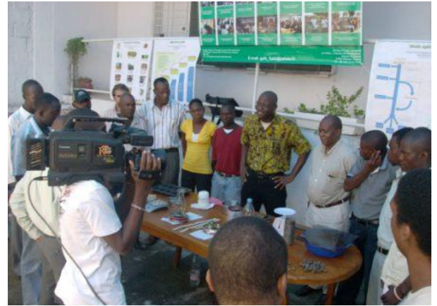
Conférence de presse

Ensuite un véritable échange, jumelage et unicité dans les objectifs de développement communautaire et local entre Haïti et le Niger est en marche afin d'avoir un meilleur im-