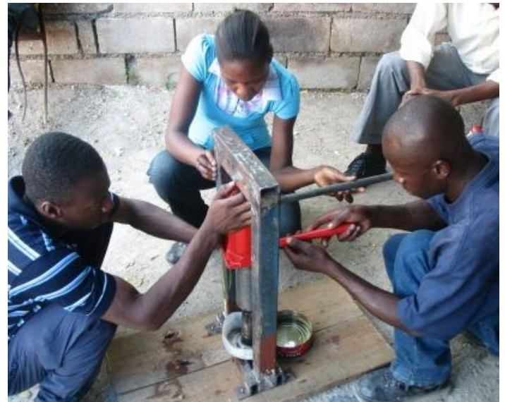
Premier prototype de presse manuelle à Jatropha

culteurs et mettre au point une presse manuelle, un réchaud, une lampe et fabriquer du savon à base d'huile de Jatropha.