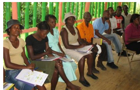
SKDK, Carice, Nord-Est

avec des partenaires locaux impliqués dans le développement local: Sant Kiltirèl pou Devlopman Karis (SKDK), Collectif Régional des Organisations du Sud-Est (KROS), autorités locales.