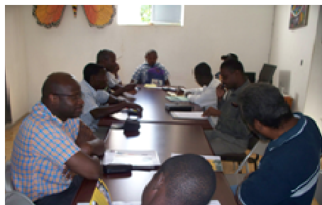
Conférence de presse autour du plaidoyer à Jacmel

pour mieux comprendre les enjeux du développement local. Chaque forum est largement médiatisé à travers la presse locale et nationale.