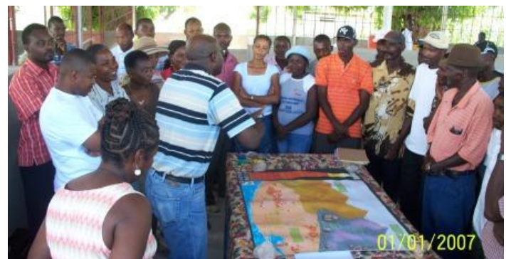
Saint-Michel de l'Atalaye joue NENCO

A Carice (Nord-Est), Jacmel (Sud-Est) et Saint-Michel de l'Atalaye (Artibonite) le GA-FE a animé trois fora de trois jours